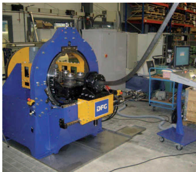
PM1409-02