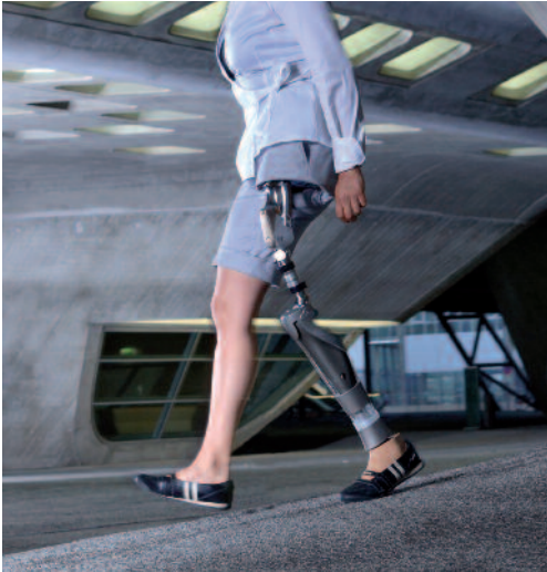
PM 1409-03